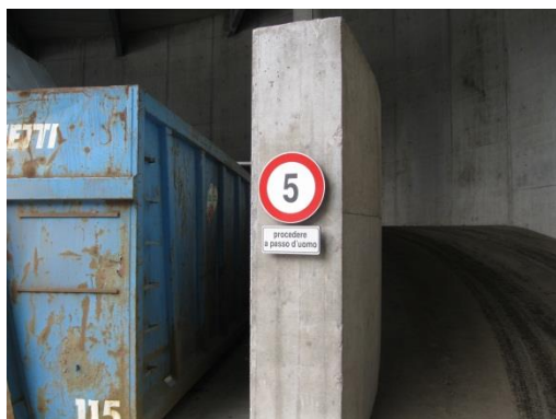
Rampa di accesso carrabile per la zona di scarico nei container sotto la tettoia