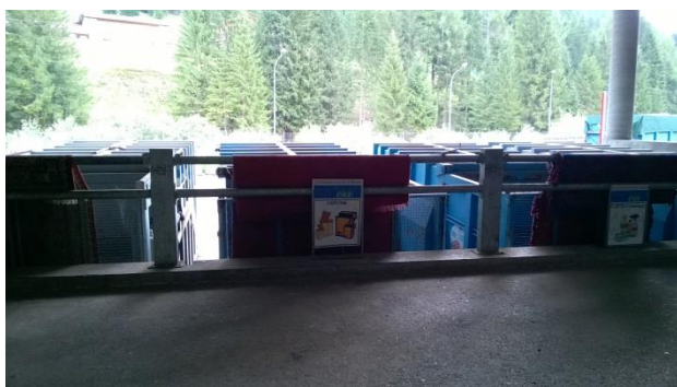
Zona di scarico nei vari container sotto la tettoia