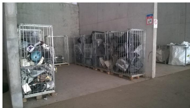
Zona scarico e deposito rifiuti elettronici sotto la tettoia