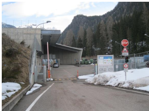
Zona di ingresso al Centro

L'area di conferimento e deposito dei rifiuti pericolosi è protetta dagli agenti atmosferici mediante copertura fissa. Tale zona è dotata di opportuna pendenza, in modo da convogliare eventuali sversamenti accidentali ad un pozzetto di raccolta con vasca a tenuta stagna.