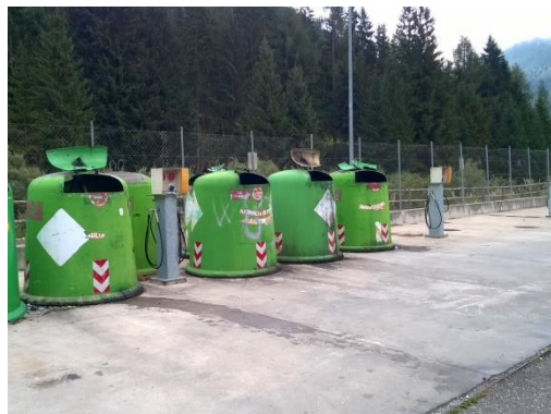
Zona di deposito campane, compattatori e container a cielo aperto