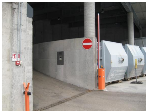
Uscita carrabile dalla zona di scarico nei container sotto la tettoia

I materiali dovranno essere conferiti direttamente dai cittadini, residenti e/o proprietari di civili abitazioni, dalle attività economiche iscritte a ruolo nelle limitazioni previste dai regolamenti interni ai Centri e soprattutto dalle limitazioni contenute nelle deliberazioni di assimilazione dei rifiuti speciali a quelli urbani.