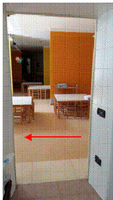
PERCORSO PRIMO PIANO SCUOLA MATERNA CHE CONDUCE ALLA CUCINA