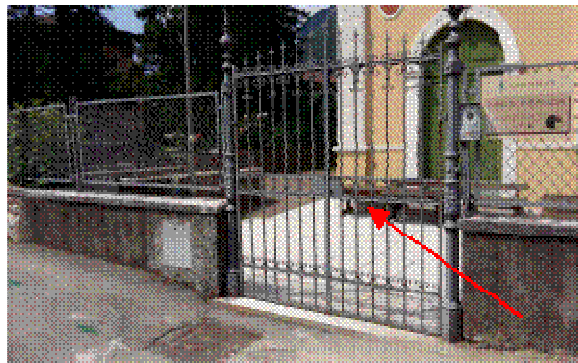
ACCESSO PEDONALE DA VIALE DEGASPERI