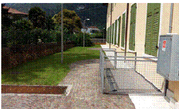
PERCORSO PEDONALE DI ACCESSO ASILO NIDO