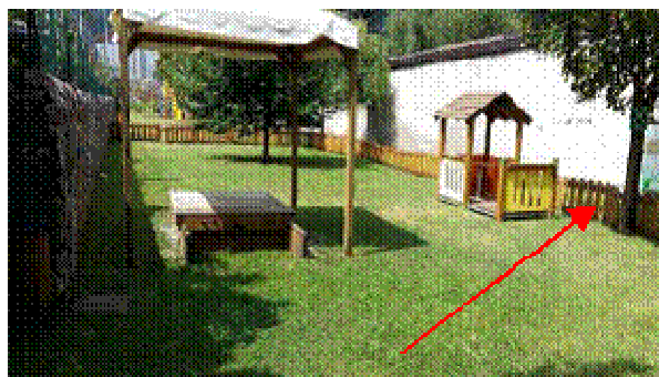
SPAZI ESTERNI SEPARATI DALLA SCUOLA MATERNA CON PICCOLO RECINTO IN LEGNO