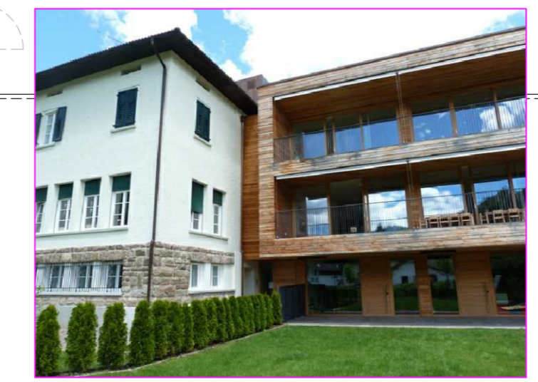
Vista A - prospetto edificio

COMUNE DI CASTELLO-MOLINA DI FEMME PROVINCIA DI TRENTO