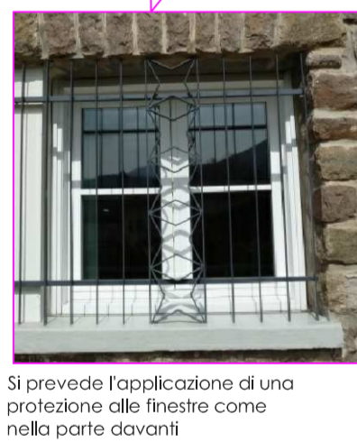
Si prevede l'applicazione di una protezione alle finestre come nella parte davanti

LAVORI PER ADEGUAMENTO AL D.M. 16/07/2014 ANTINCENDIO ASILO NIDO SCALE: - Alla sommità della scala al piano secondo viene realizzata una velux/apertura di areazione, di superficie non inferiore ad 1 mq, con sistema di apertura comandabile sia automaticamente dai rivelatori di incendio che manualmente mediante dispositivo posto in prossimità all'entrata della scala, in posizione segnalata. USCITE: - Viene realizzata la seconda uscita ricavando per il Piano Secondo, una porta verso la scuola materna e per il Piano Primo una scala esterna in acciaio zincato che porta al Piano Terra. - La larghezza delle uscite è di minimo 0,9 m. - Le porte di uscita verso il vano scale principale, del Piano Primo e del Piano Secondo vengono sostituite con porte REI60. IMPIANTI DI RILEVAZIONE, SEGNALEZIONE ED ALLARME: - L'attività viene dotata di impianti fissi di rivelazione, segnalazione e allarme incendio in rispetto del decreto del Ministero dell'Interno del 20 dicembre 2012 applicando la norma UNI 9795. IMPIANTO ANTINCENDIO - Al Piano Primo ed al Piano Secondo vengono installati naspi collegandosi alle tubazioni già predisposte.